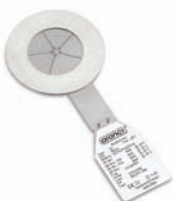
Berstscheibe bursting disk