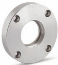
Flansch mit Gewinde threaded flange