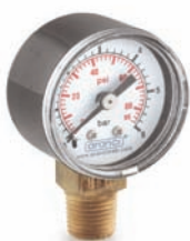
PVC Manometer PVC manometer