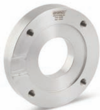
Flansch welding flange

Zubehör und Ersatzteile / accessories and spare parts