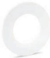
Dichtung PTFE PTFE seal