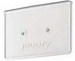
Silikonichtung Silicon seal